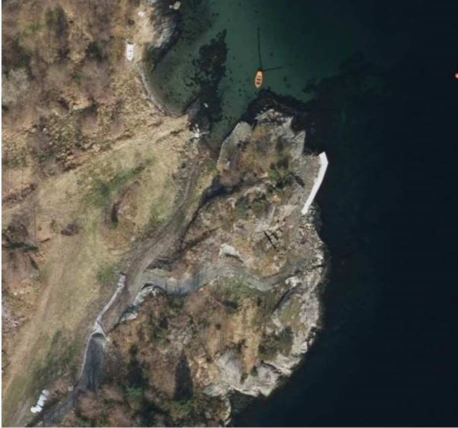
Utsnitt frå 2016 syner ferdig grusa veg og planerte areal i strandsona, samt etablering av større kai på innsida av neset. Kaien er utvida med om lag 50 m 2 :