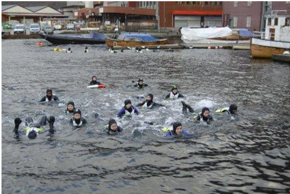
Norges Fiskerimuseum og Bergen Kystkultur-senter i Sandviken var arena for det meste av aktiviteten under Snakkast på fjorden i 2020. Her er det elevar frå Rothaugen skule som sym i fjorden.

Skuleopplegget rettar seg særleg mot elevar frå ungdomsskulen. Fylgjande aktivitetar vart i år brukt: segling med havsegjar, roing/segling/fiske med tradisjonsbåtar, coasteering/vanntryggleik/livredning frå Coasteering og Redningselskapet og ulike stasjonar på land om miljøvern, plastproblematikk og bærekraftsmåla til FN-sambandet.