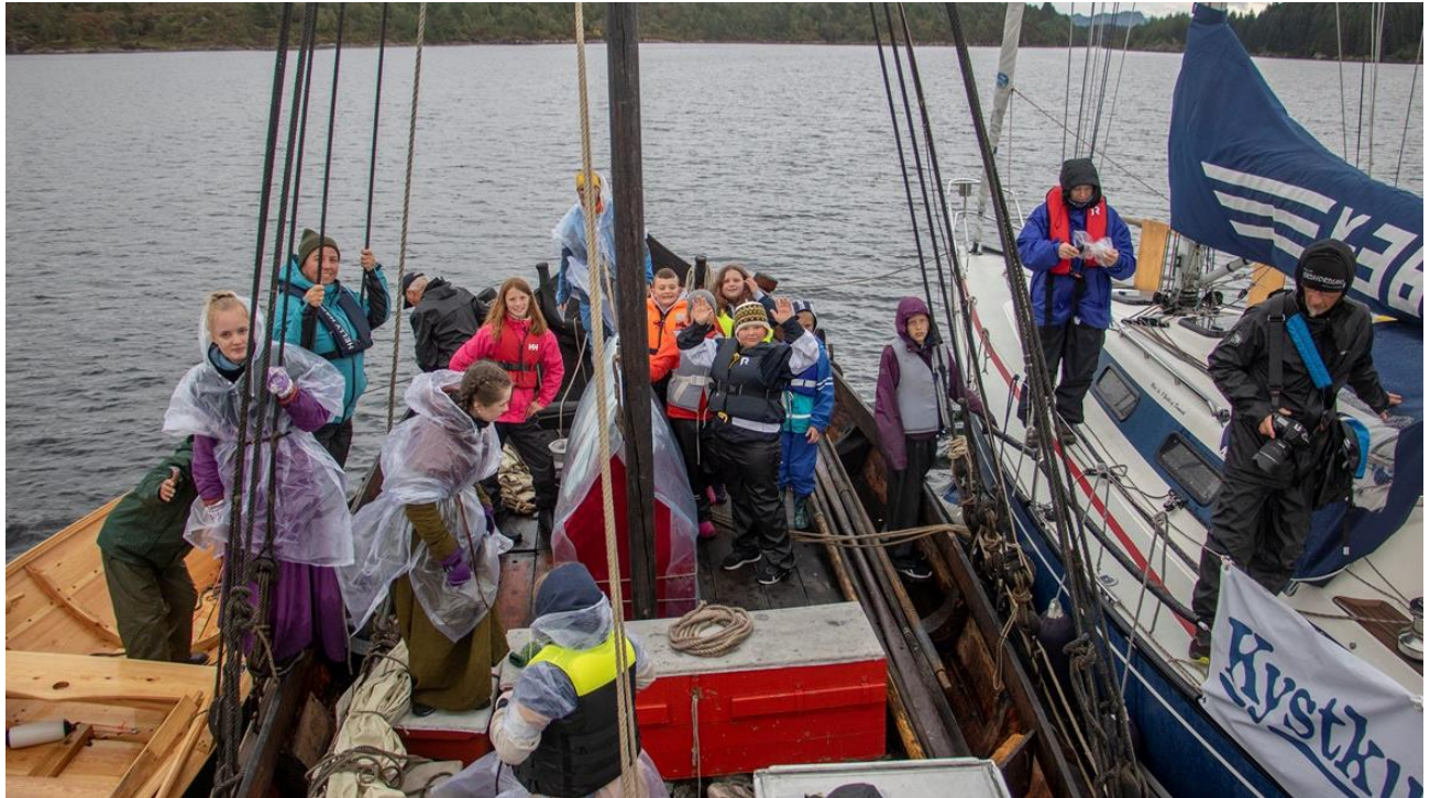
Eit snakkast på fjorden-møte mellom seksæring, jekt og havsegjar. Skuleelevar frå Austebygd skule på Radøy møter Sunnivaseglasen utanfor Sletta kai 3. september.