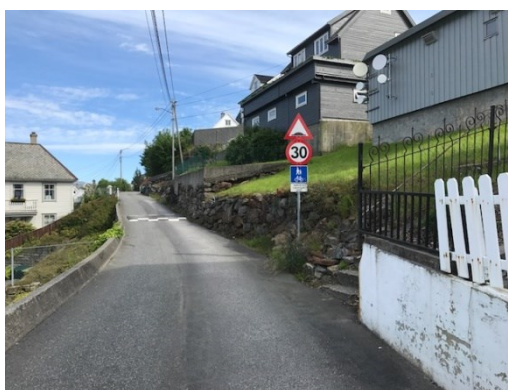
Figur 1 Skilt 522 med underskilt i Bryllupshaugen sør