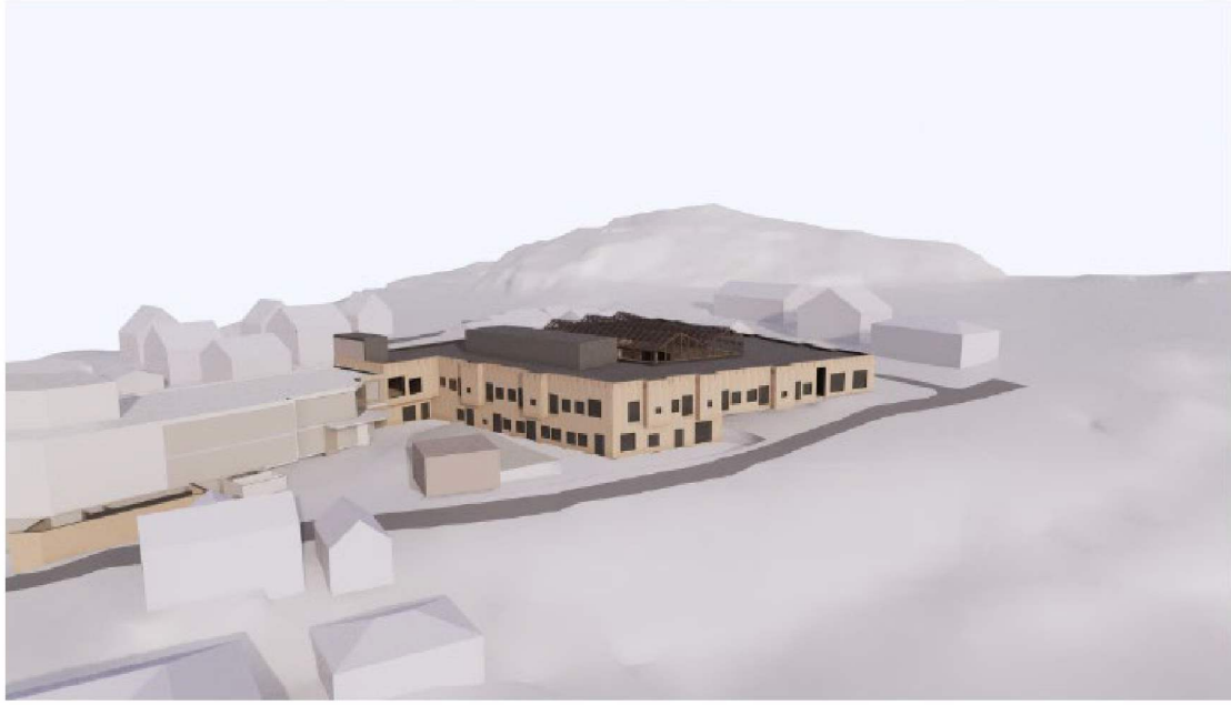
Nybygg sett frå sør