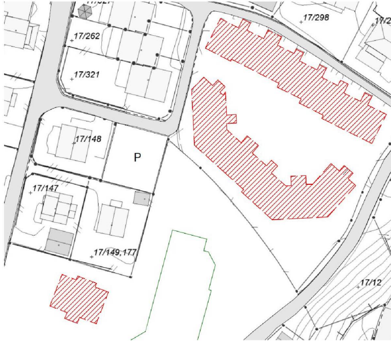
Kartutsnitt eksisterende boliger inkl. Maritvoll

Arbeidet omfatter 15 stk. omsorgsboliger og tilhørende utomhusarealer som må bearbeides/fjernes for å gi plass for nytt anlegg, se Kartutsnitt eksisterende boliger. Maritvoll skal også rives inkl. kjeller, samt at grunnen skal planeres etter at rivearbeidene er ferdig. For begge riveprosjektene forutsettes det at alle konstruksjoner som ikke kan benyttes på stedet fjernes og leveres til godkjent depot.