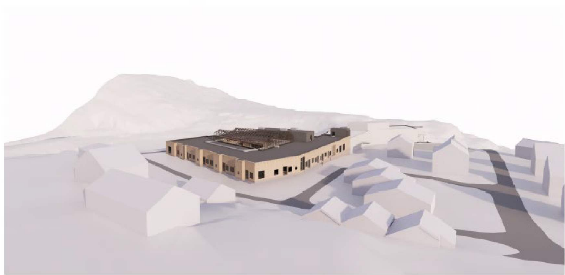
Nybygg sett frå nord