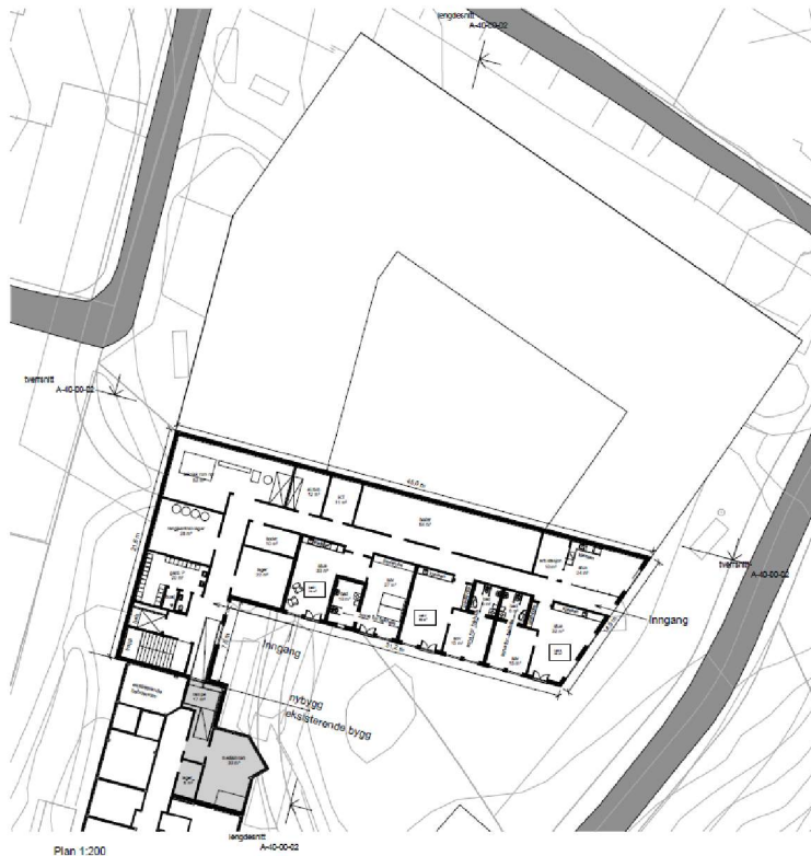
Plan 1 Ombygging i sykehjem og nytt vaskeri