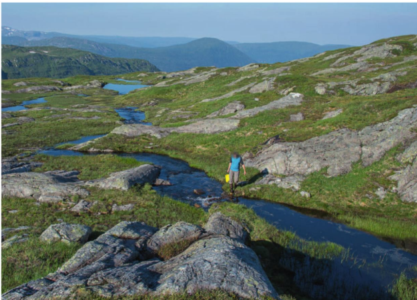
FRYKTER TØRRLEGGING: Elven som renner ut fra Krossstjørnane mot Bogevatnet blir tørrlagt hvis kraftverket Boge 3 blir realisert, fastslår SV. Lokalpartiet i Vaksdal er kritisk til den politiske prosessen som fikk kommunestyret til å snu fra nei til ja til konsesjon.

Hun fikk full støtte. Kommunestyremøtet gjorde følgende enstemmige vedtak: "Vaksdal kommune fraråder at det blir gitt konsesjon for Boge 3 kraftverk. Bogevatnet vil bli brukt som kommunal drikkevannskilde i to til tre år til og senere som reservevannkilde. Tiltaket kan gi negative effekter for dette."