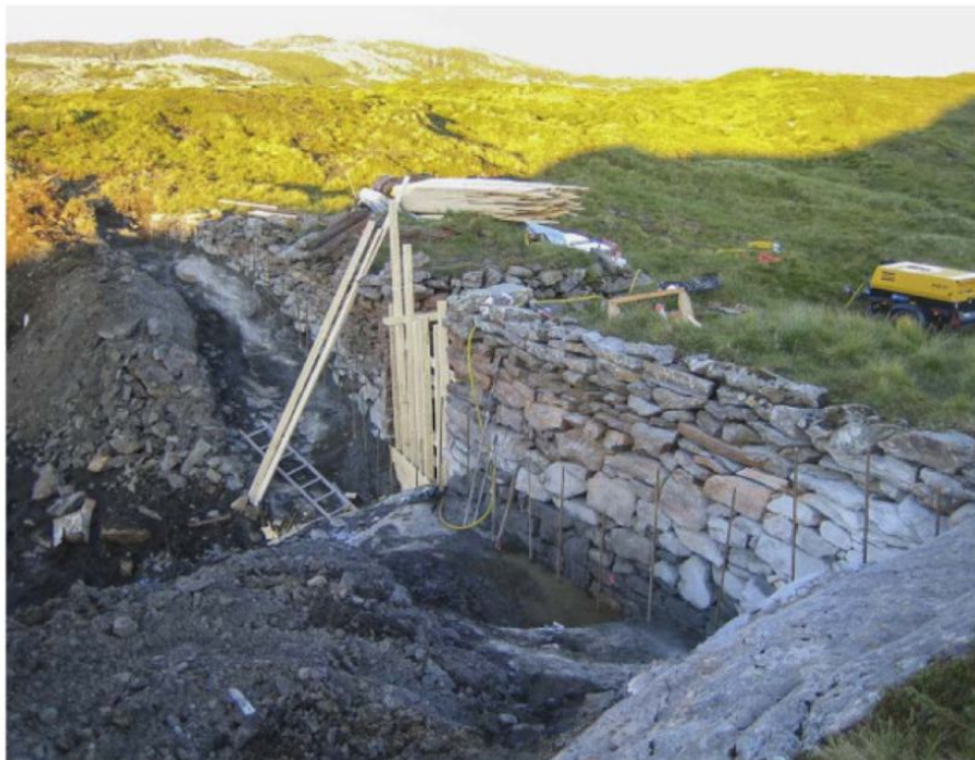
ALLEREDE UTBYGD: Vassdraget der det har oppstått strid om nytt kraftverk, det såkalte Boge 3, er allerede utbygd. Her fra utbedringen av demningen på Krosstjørnane i forbindelse med Boge 2. Her måtte Krosstjørnane tappes helt ned.

– Den 25. august opplyser Stanghelle Aktivitetspark på Facebook at de hadde fått midler fra Trond Mohn. Det var også da jeg fikk vite om det første