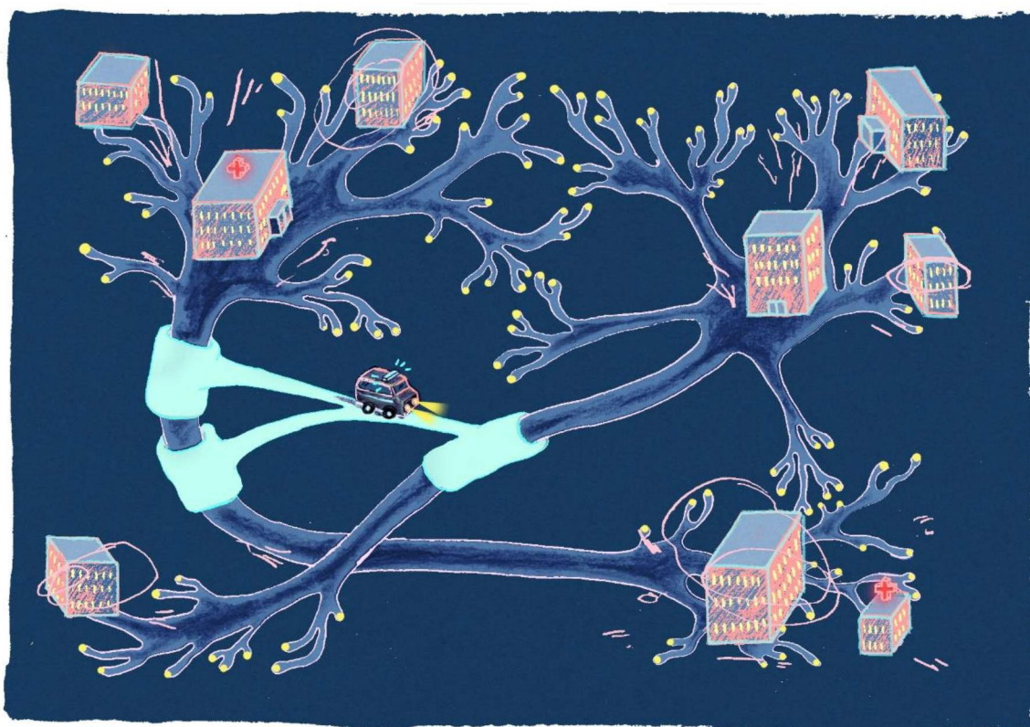
1Illustrasjon: Sylvia Stølan