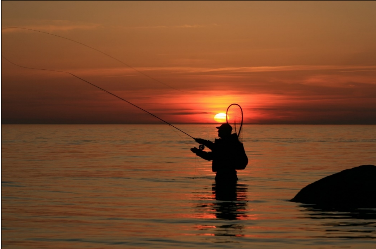
Figur 3. Sportsfiske i sjø.

Garn med maskevidde mindre enn 32 millimeter, vil framleis kunne fange effektivt på utvandrande laksesmolt og små sjøaure. Eit garn med maskevidde på 29 millimeter vil til dømes vere effektivt på fisk i storleik 25 – 32 cm. Garn er til ein viss grad selektivt på storleik, men sjølv i garn med små maskevidder tiltenkt liten fisk, kan større fisk sette seg fast.