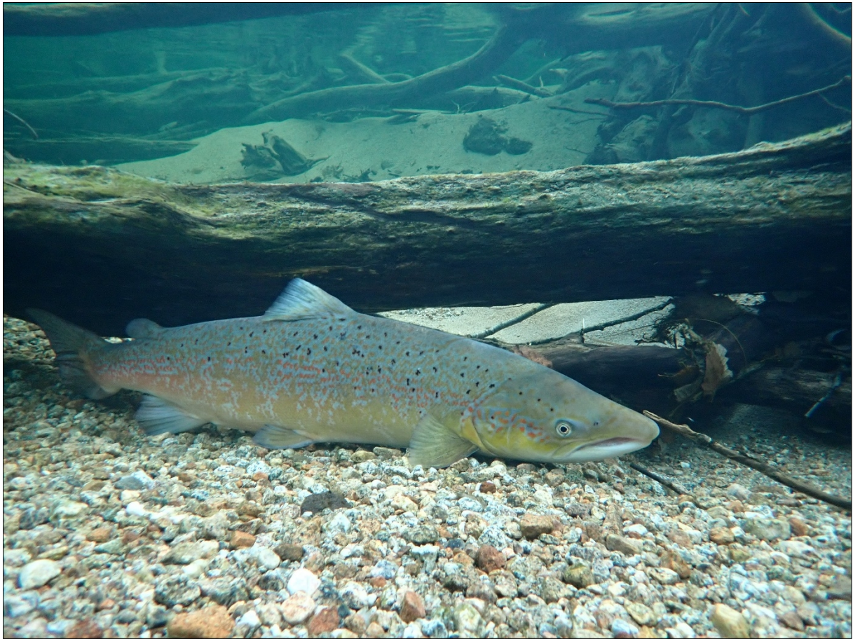
Figur 1. Hanlaks som nyttar tre og røter som skjul.

Osterfjorden og Nordfjord er det merkeprosjekt for å registrere ut- og innvandrande laksefisk. I tillegg vert det utført fiskeundersøkingar ved konsekvensutgreiing av ulike utbyggingar.