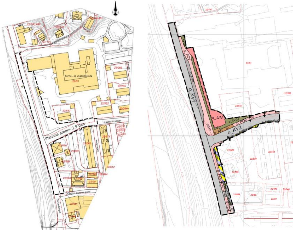
Figur: Planområdet T.v. og planforslaget T.h.