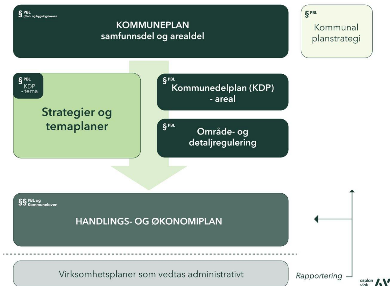
Figur 1: Plansystemet i kommunane

Satsingsområde, mål og strategiar i samfunnsdelen skal bli følgt opp i andre strategiar og planverk, og i vårt daglege virke.