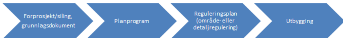
Figur; planfasar for utbygging

Vaksdal kommune står framfor store endringar i transportinfrastrukturen, etter regjeringa sitt vedtak (desember 2015) om utbygging av ny E16 og dobbeltspora jernbane på strekninga Arna-Stanghelle. Vedtaket er i tråd med etatane si tilråding om alternativ K5 i KVU Voss-Arna frå 2014. Vedtaket føreset statleg plan, direkte på reguleringsplan for dei to parallelle utbyggingane. Statens vegvesen og Jernbaneverket (SVV/JBV) gjennomfører i 2016 eit forprosjekt som grunnlag for val av trasèar. Forprosjektet er eit (av mange) grunnlagsdokument for utarbeiding av planprogram.