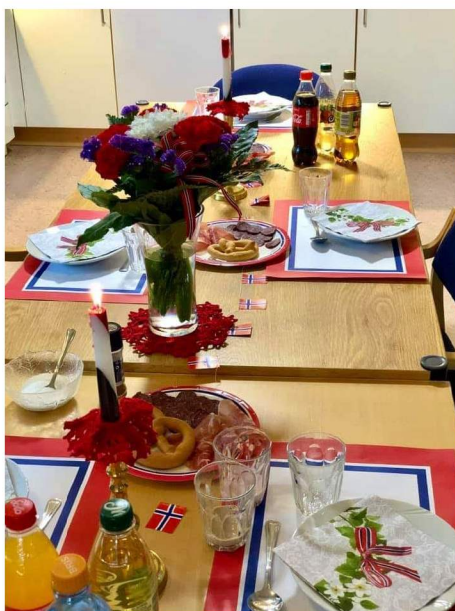
Bilde frå 17.mai 2020