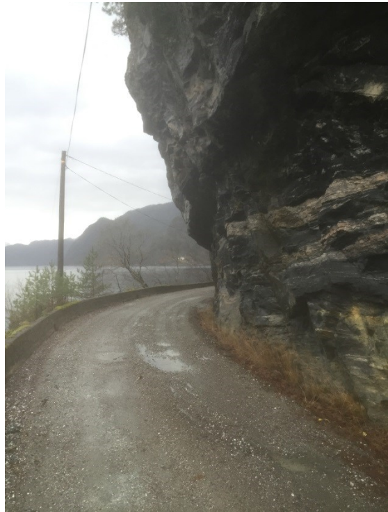
Overheng mellom Grøsvik og Gammersvik, drypp frå fjell vil gje hull i asfalt utan tiltak.

Grusvegen frå Gammersvik til Grøsvik på om lag 3 km utgjer kring 4 800 rutemeter med nytt fast dekke. Med bakgrunn i asfalt anbod i 2014 utgjer prisen på nytt dekke (Type Agb 11, 110 kg/m 2 ) 150 kr/m 2 i 2014 kroner. Det vil seie ein kostnad på 760 000 kroner i 2016 kroner.