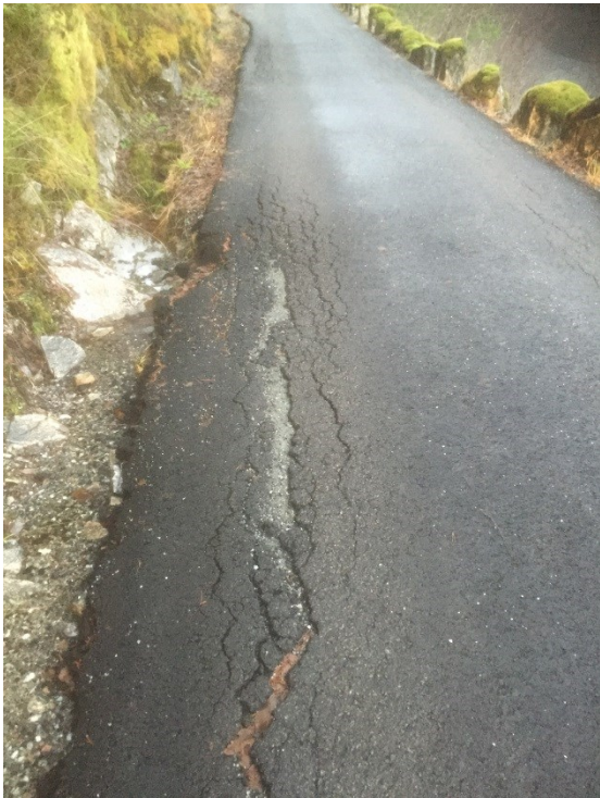
Døme på oppsprekking av vegbane.

Det nylagte asfaltdekke frå Hellingen til Gammersvik har som det går fram av bileta i saksframlegget fått omfattande skadar. Skadane kjem i hovudsak som følgje av mangelfull kantforsterking/smål veg og svikt i vegfundamentet. Ein kan ikkje sjå bort i frå at manglar ved sjølve asfaltdekket også kan vere ein faktor. Dette er noko vi vil undersøke nærare som del av tilstandskartlegginga av kommunale vegar.