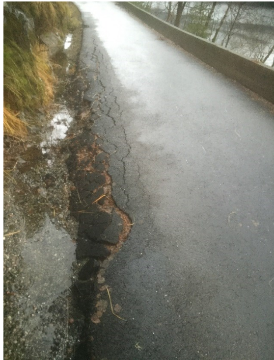
Døme på oppsprekkande i vegkant.