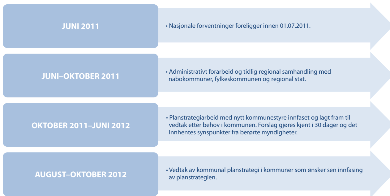
Figur 6. Hovedfaser i «Planstrategiåret» for kommende valgperiode