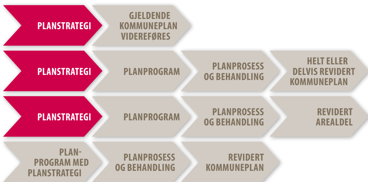
Figur 2. Behovstilpasset revisjon av kommuneplanen. Blå bokser er trinn i en kommuneplanprosess.

Gjeldende kommuneplan kan videreføres i sin helhet, slik at videre planlegging for eksempel skjer gjennom kommunedelplaner eller annen tema- og sektorplanlegging, kommuneplanen kan revideres helt eller delvis, eller det kan være behov for revisjon av bare samfunnsdelen eller bare arealdelen. Denne fleksibiliteten er vist i figur 2.