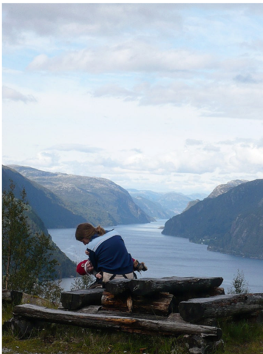
Veafjorden sett fra Langhelle