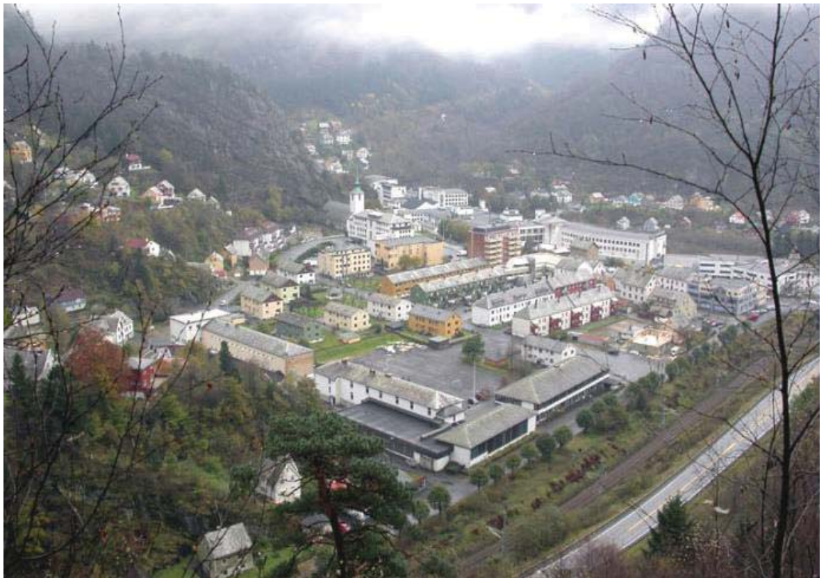
Skuleområdet og sentrum sett frå nord.