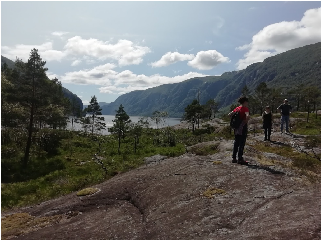
Figur 4: Bilete frå synfaringa, frå plasseringa som er valgt for dagsturhytta på Tettaneset