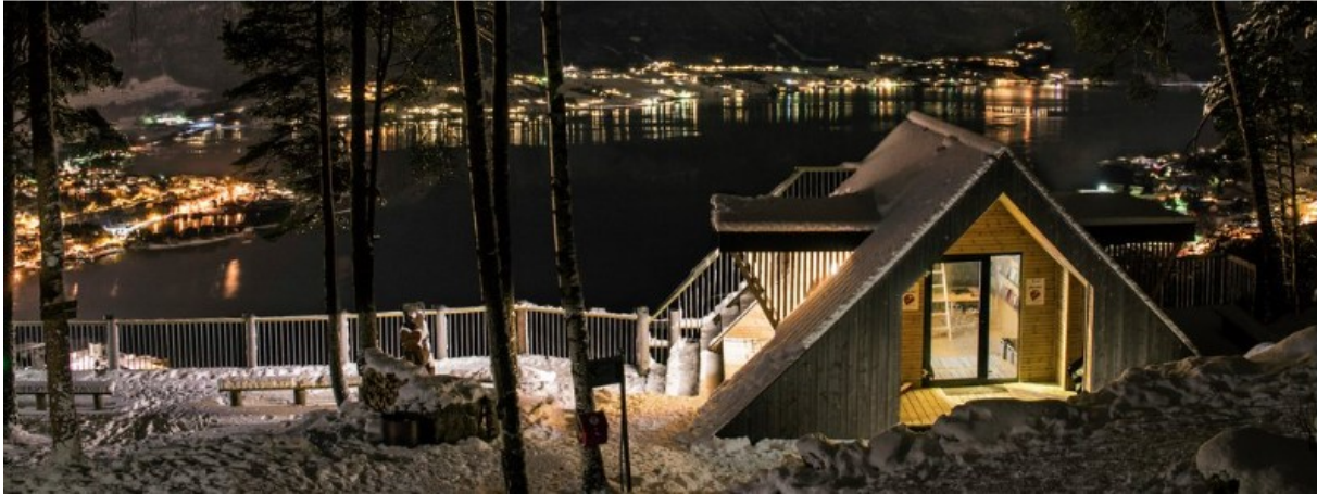
Figur 1: Dagsturhytta i Gloppen. Alle Dagsturhyttene har same størrelse og utforming.

Vurdert opp mot kriteria peikar Tettaneset seg ut, og i samarbeid med DnT Vaksdal, Stanghelle vel og Stanghelle idrettslag er plassering føreslått.