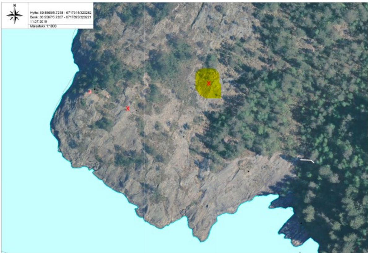
Figur 5: Plassering av hytta er markert med gul