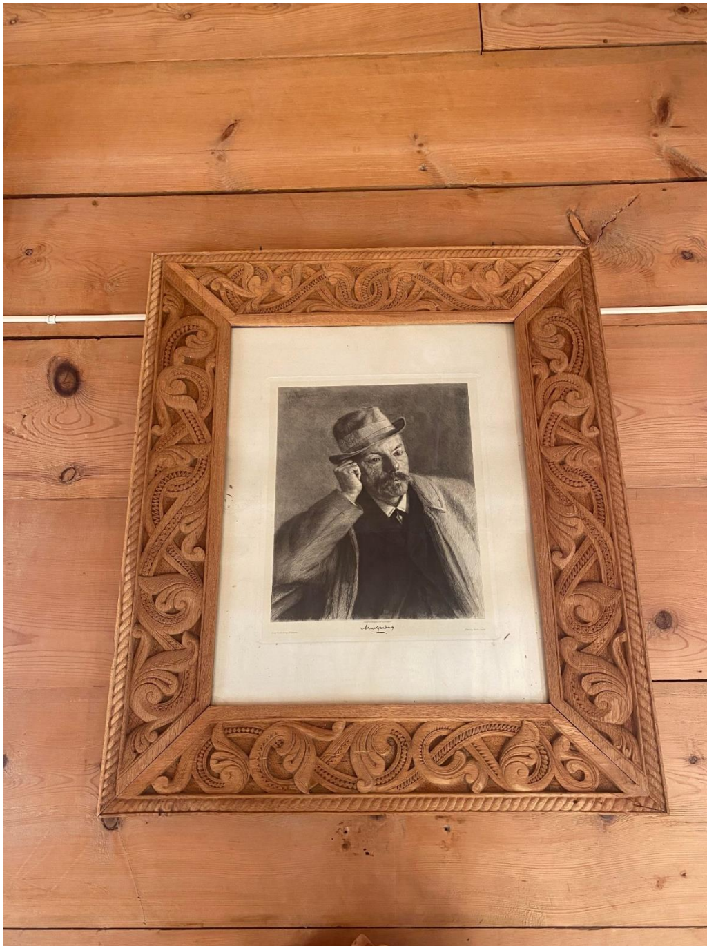
Arne Garborg. Inspirator både for nynorsk språk og nasjonalkjensle Ramma er skore i Eksingedalen tidleg på 1900-talet.

Grendahuset Ljosheim, stifta 1897. Adr: Eksingedalsvegen 1080, 5728 Eidslandet. Org. nr: 922703108. Kontonummer: 3480.17.52650