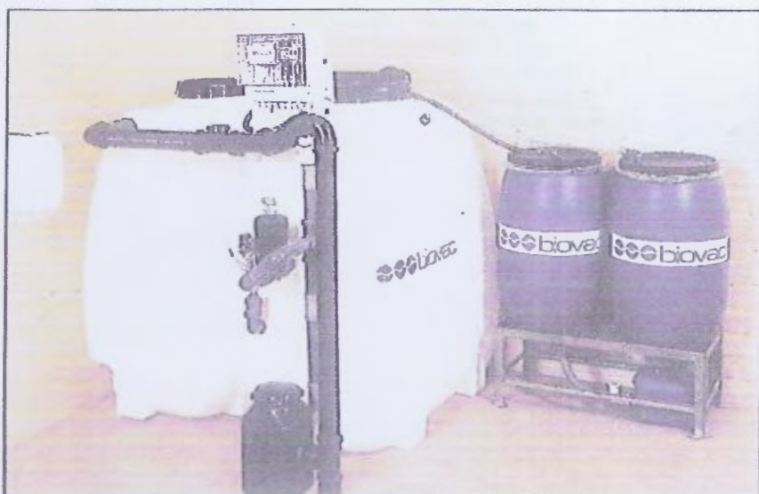
Anlegg for en boenhet/hytte montert i anleggsrom