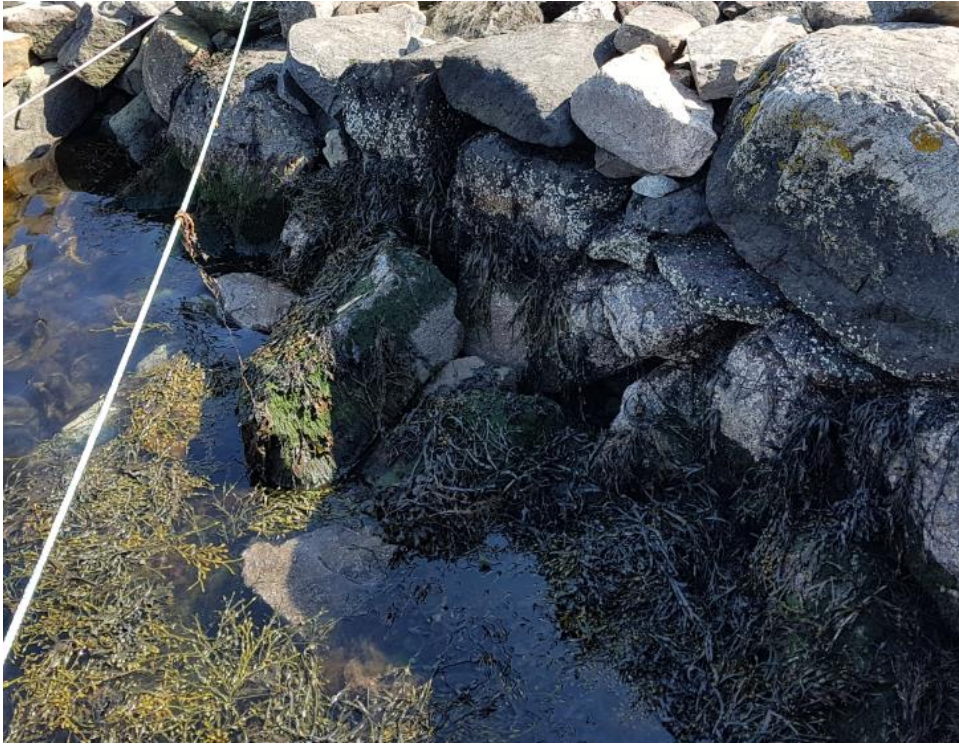
Bilde 03 - Aktuelt nøst som viser steinblokker som har rast ned med strømminger og storm.