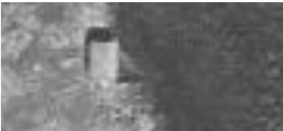
Bilde 10 – Ortofoto fra 1966 av det aktuelle nøstet nøst og våningshus.

Bilde er ikke akkurat høyoppløselig, men jeg vil påstå at man ser ganske «tydelig» omrisset av de omtalte utstikkerne. Uansett ble nøstet bygget tidlig på 1900 tallet og det er veldig sannsynlig at