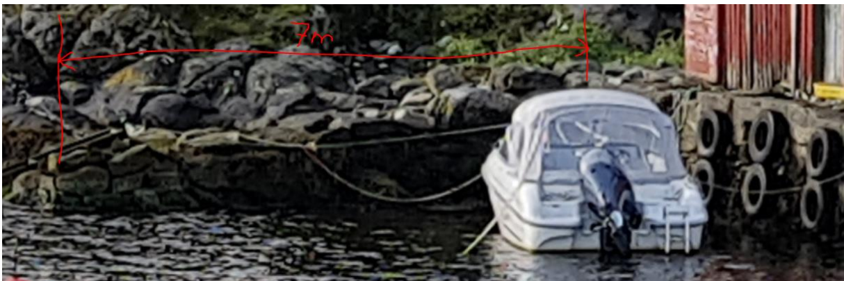
Bilde 02 - Aktuelt nøst som viser det som står igjen av utstikker i dag 7m (se mål merket med rødt).