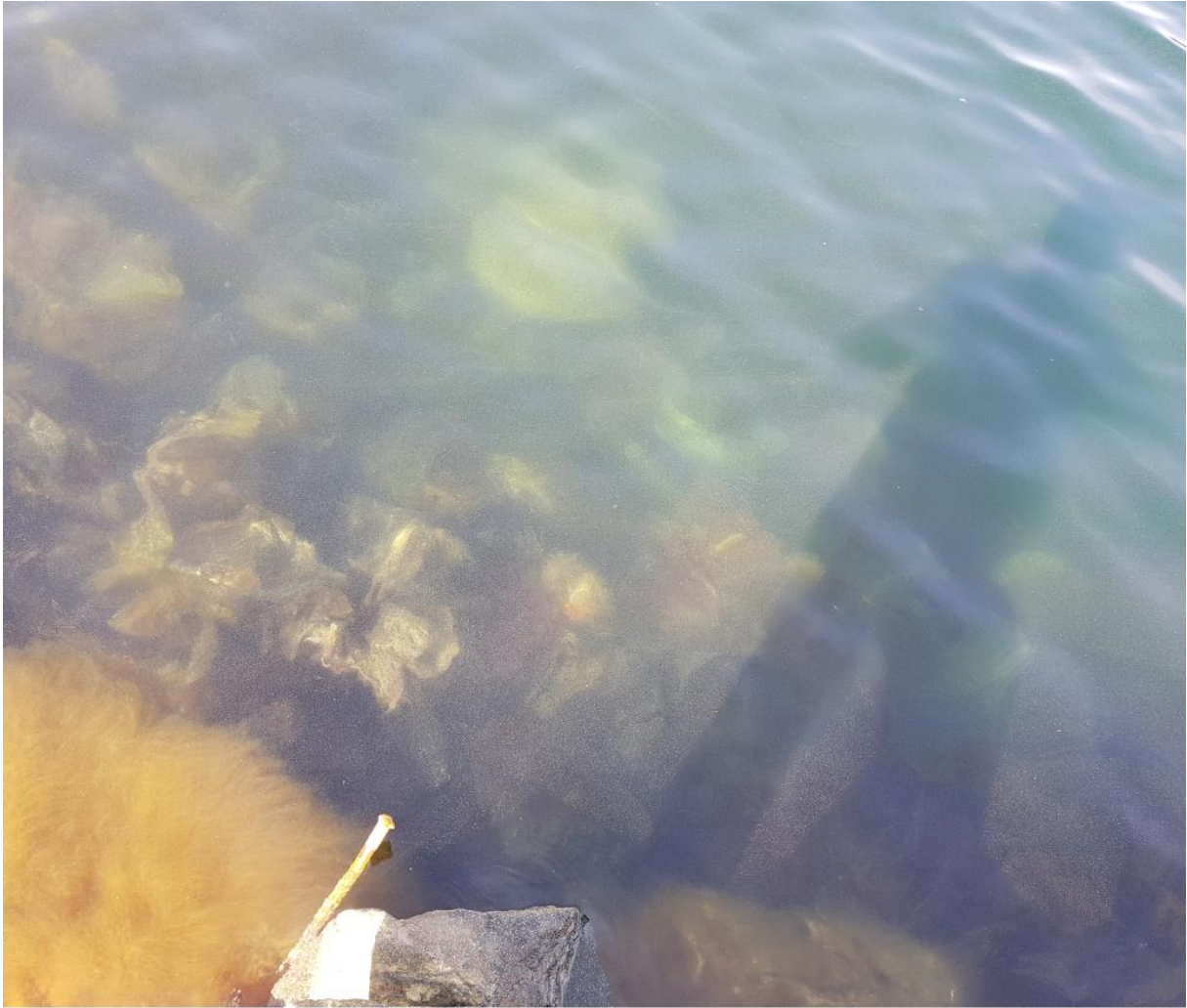
Bilde 05 - Aktuelt nøst som viser steinblokker som har rast ned med strømminger og storm.