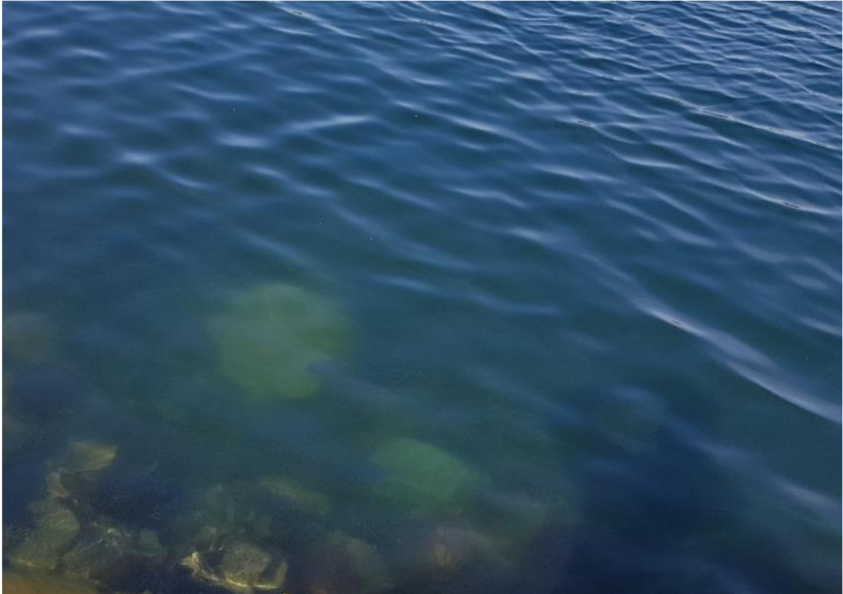
Bilde 07 - Aktuelt nøst som viser steinblokker som har rast ned med strømminger og storm.

Som en ser på bilde 02 er gjenstående del av utstikker ca. 7m. Utstikker har tidligere vært lengre og høyere, en kan tydelig se steinblokker som er rast ned rett ved siden av utstikker, litt dypere foran utstikker, og på rundt 10m dyp (vi anslår at det er rundt om 6m 3 med steinblokker som er rast ut. Vi har hatt dykker som har vært nede og sett). I søknaden har vi bedt om 7,25m lengde på utstikker, vi ønsker å bygge den opp slik den var med blokker som er rast ut. Da vil den blir flat og kan brukes ved høyvann også.