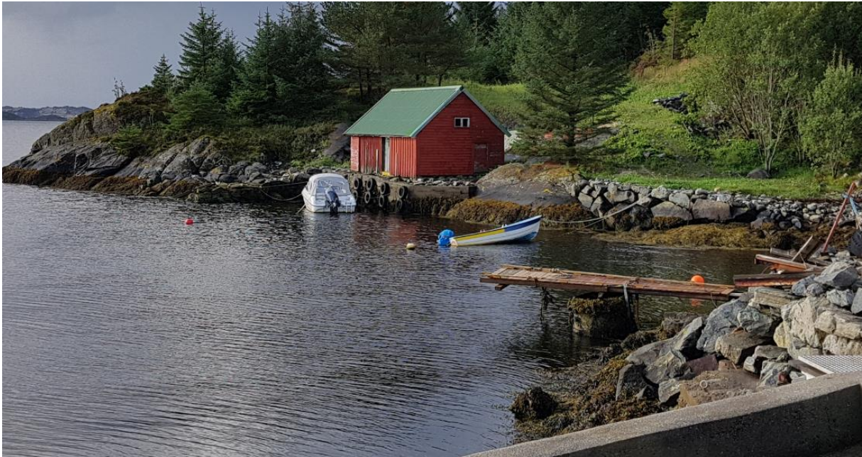
Bilde 01 - Aktuelt nøst tatt fra nabotomt

Her er noen bilder som forklarer hvorfor dette er eksisterende struktur: