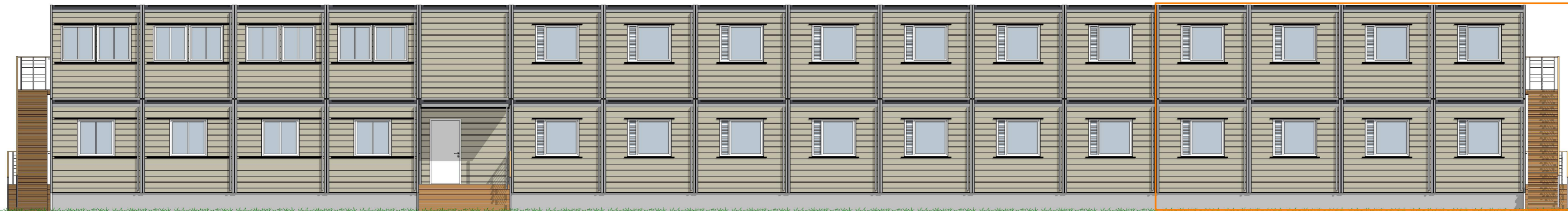
Fasade 2 1:100

omsøkt- eksisterende del av brakkeriggen (midlertidig i 2017-2019)