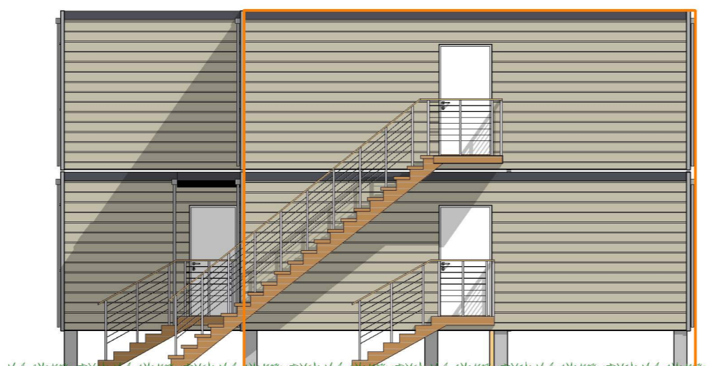
Fasade 3 1:100