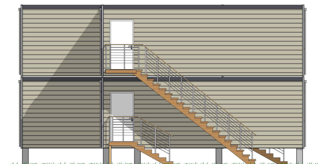
Fasade 4 1:100