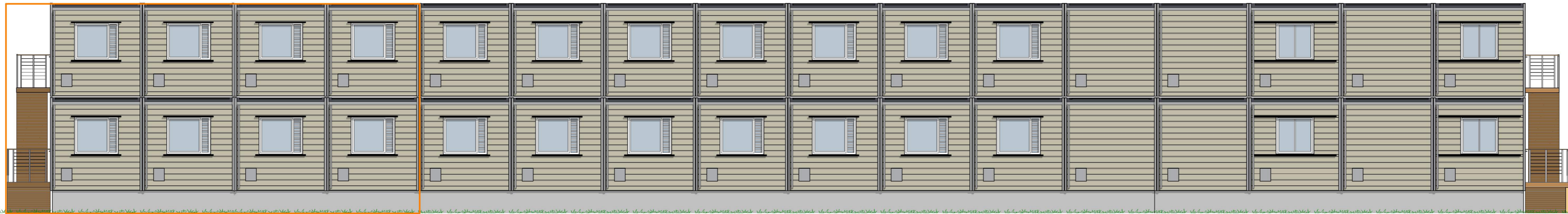
Fasade 1 1:100