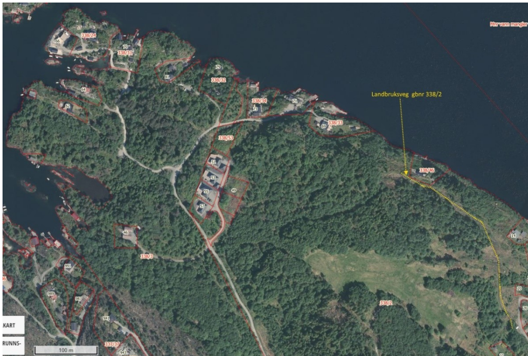
Nordhordland i bilder 2018 – illustrert tilkomstveg og bilete vist til i klagen