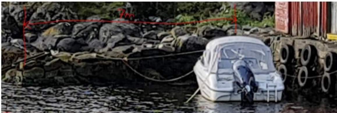
Bilde 02 - Aktuelt nøst som viser det som står igjen av utstikker i dag 7m (se mål merket med rødt).