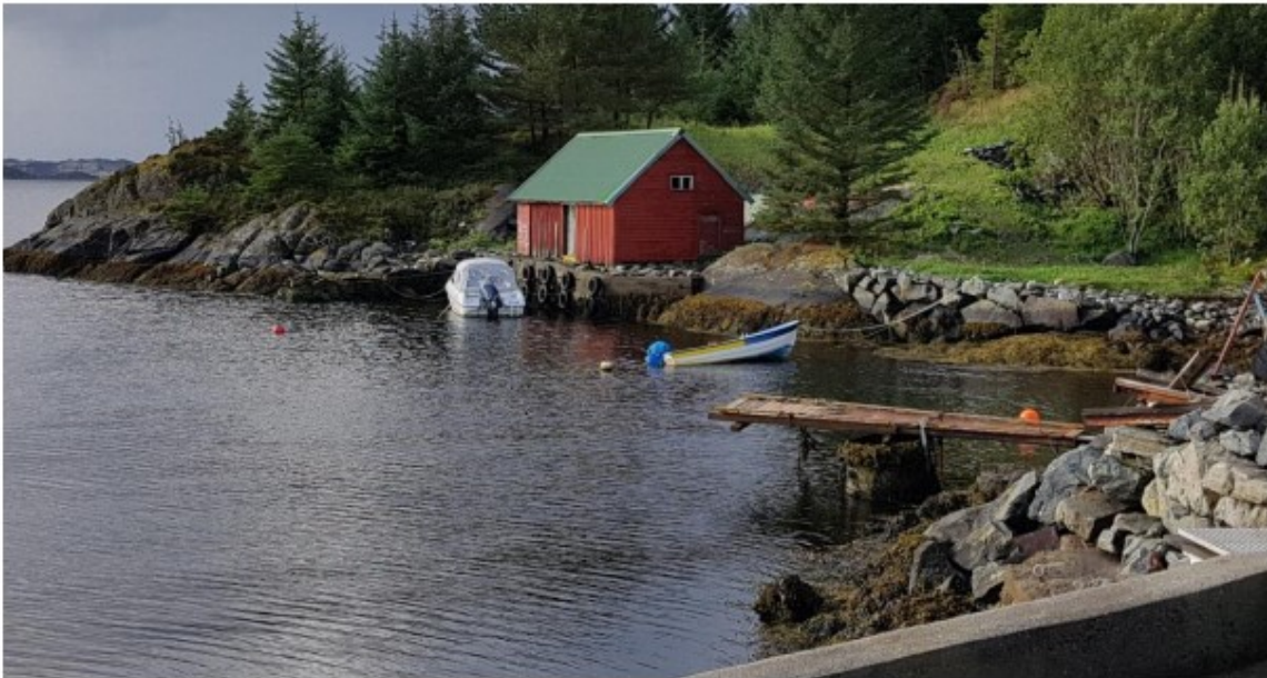
Bilde 01 - Aktuelt nøst tatt fra nabotomt

Her er noen bilder som forklarer hvorfor dette er eksisterende struktur: