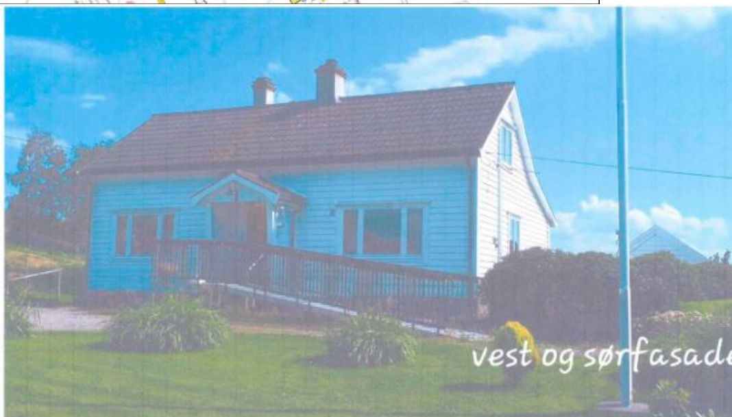
Ny fasade mot vest