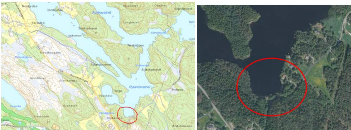
Raud ring viser området der det er søkt om for grunnundersøkingar.

I samband med val av ny vegtrase for pågåande reguleringsplan for Fv. 564 Fløksand – Vikebø, planid 125620160010 har Asplan Viak på vegne av Statens vegvesen søkt om løyve til å gjennomføre grunnundersøkingar i Rylandsvassdraget jf. kartutsnitt under.