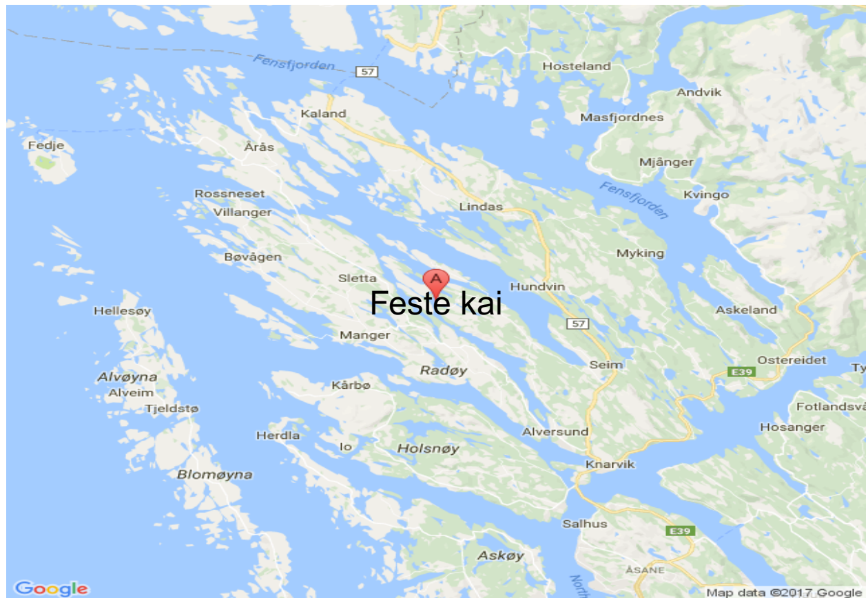
Fig. 2. Kart over Nordhordland.

Topografien i Nordhordland består i hovedsak av fjorder og daler som er orientert i sørøst-nordvestlig retning, se Fig.1. Dette ser vi avspeiler seg tydelig i vindrosen for Feste kai, Fig. 2. I over 45% av tiden blåser vinden mellom 90 og 180 grader (øst til sør) mens i ca. 18% av tiden blåser det fra motsatt retning, dvs mellom 315 og 360 grader (nordvest til nord). Vind mellom 180 og 225 grader (sør til sørvest) har vi i ca. 12% av tiden, mens de resterende vindretningene (225-315, og 0-90 grader) står bare for en liten andel av den totale vindfordelingen.