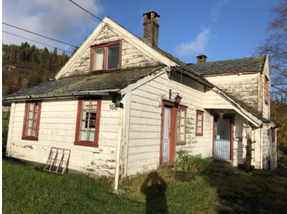
Bilde eksisterande bustad

Infrastruktur for den parsellen som vert frådelt er ivareteke, det er sikra vegrett som vist i vedlegg Q-1, offentleg vatn og avløp ligg i tomtegrensa. I og med at det i dette tilfelle er tale om å riva eksisterande bustad og erstatta med ny anser me det ikkje som utvida bruk og at avkjøring til offentleg veg difor er sikra.