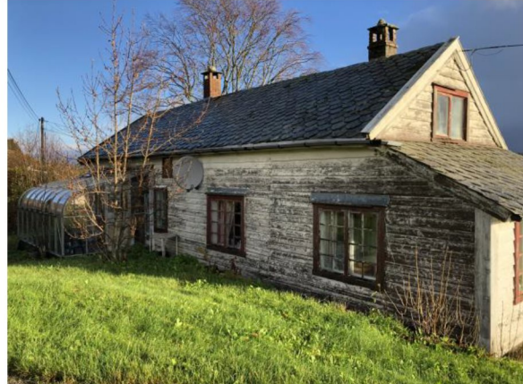
Bilde eksisterande bustad

Det er tiltakshavar sitt ynskje å sikra seg eige areal for bustad med tanke på overdraging og vidareføring av garden. Det vil vera naturleg at det som i praksis er hovudhuset vert høyrande til garden med tanke på standard på huset og i forhold til plassering mot driftsbygning og landbruksarealet på øst sida av vegen.