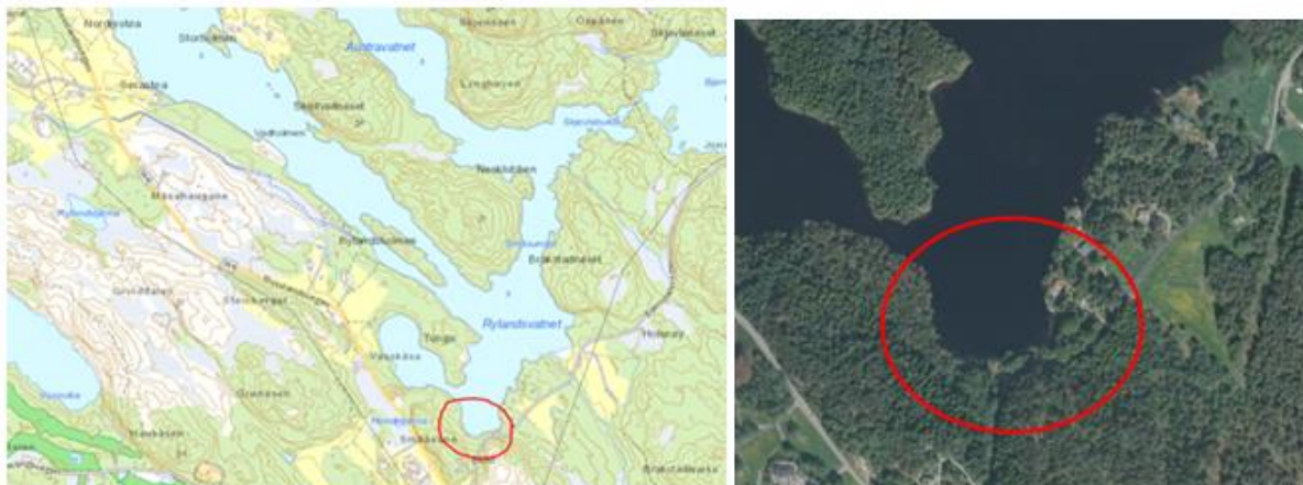
Raud ring viser området der det er søkt om for grunnundersøkingar.

Tiltaket gjeldt løyve til å gjennomføre grunnundersøkingar i og rundt Rylandsvassdraget, samt utbetring av veg ved Rylandsvassdraget jf. kartutsnitt under.