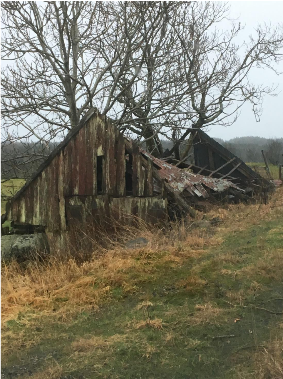
Bilete teke 23.01.2020

Det gamle våningshuset, bygningsnummer 176157208 ligg registrert i matrikkelen som revet/ brent.