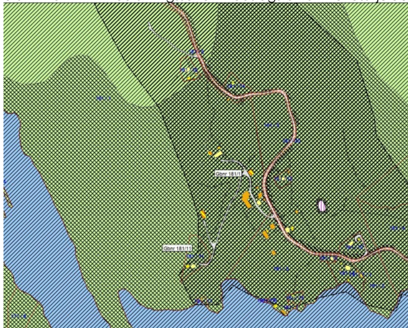
Utsnitt situasjonskart, datert 14.06.2019