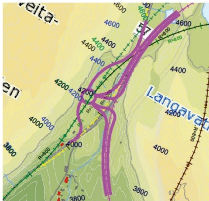
Kryss ved Isdal (i silingsrapport omtala som Åse).