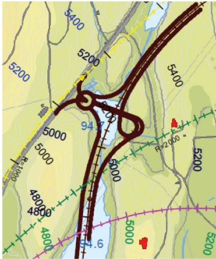
Kryss ved Åse (i silingsrapport omtala som Espeland).