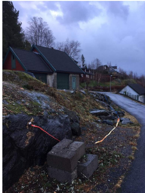
Avslutning på muren mot fjell i dagen (nord)