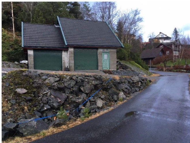
Foto fra Ørnnova/vest, mot garasjer og avkjørsel