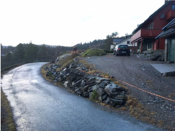
Avkjørsel fra Ørnnova