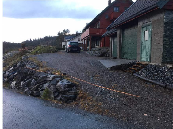
Oransje bånd viser hvor muren vil gå