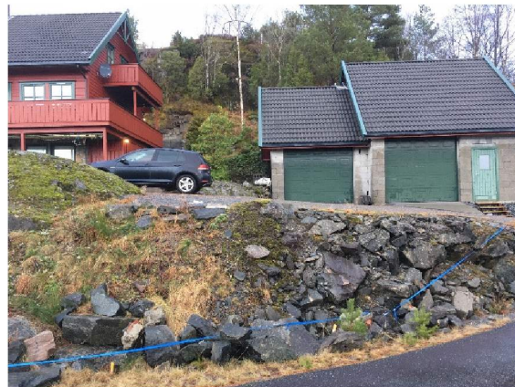
Gult og blått bånd viser hvor murfoten vil stå