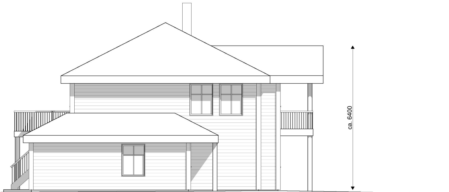
1:100 Fasade Sør