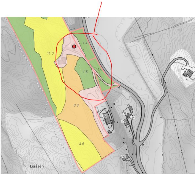
Figur 2 felt 1 ligg innanfor område i raud sirkel

Vedlagt ligg søknad og kart over heile det planlagte prosjektet