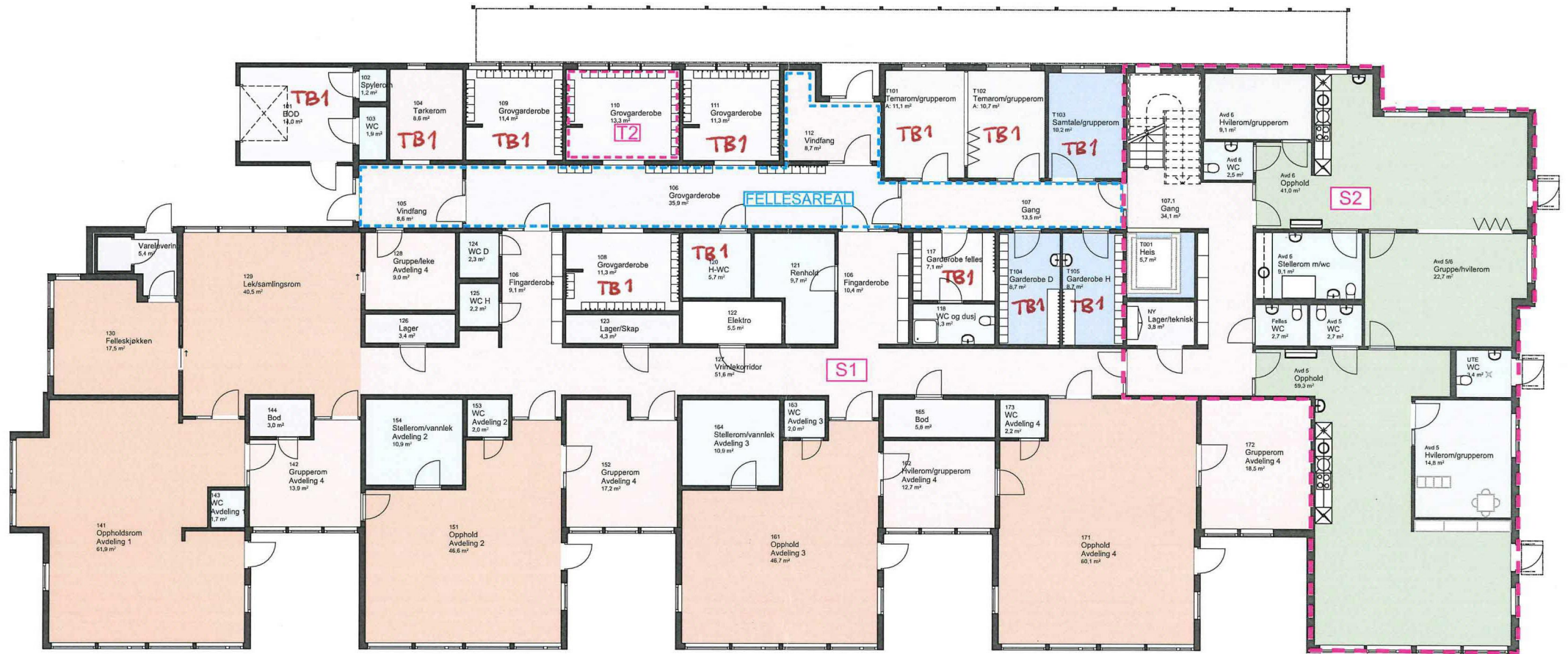
1:200 1. Etasje