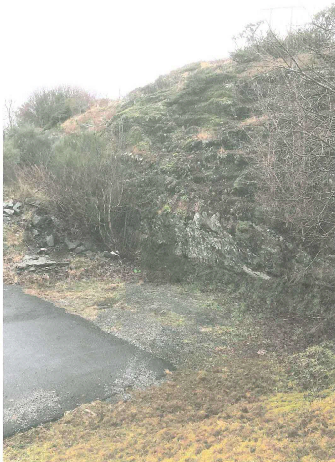
Skjæring ved eksisterande snuplass, sett mot nord.