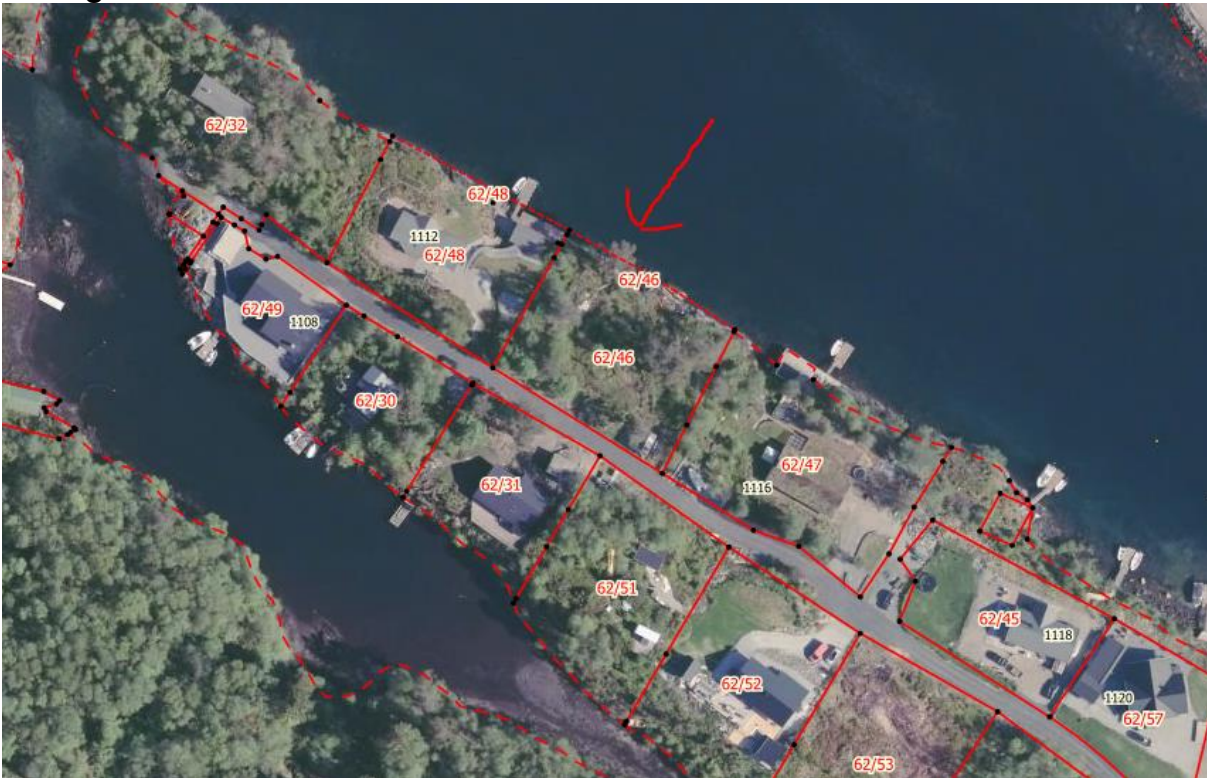
Flybilete av eigedom