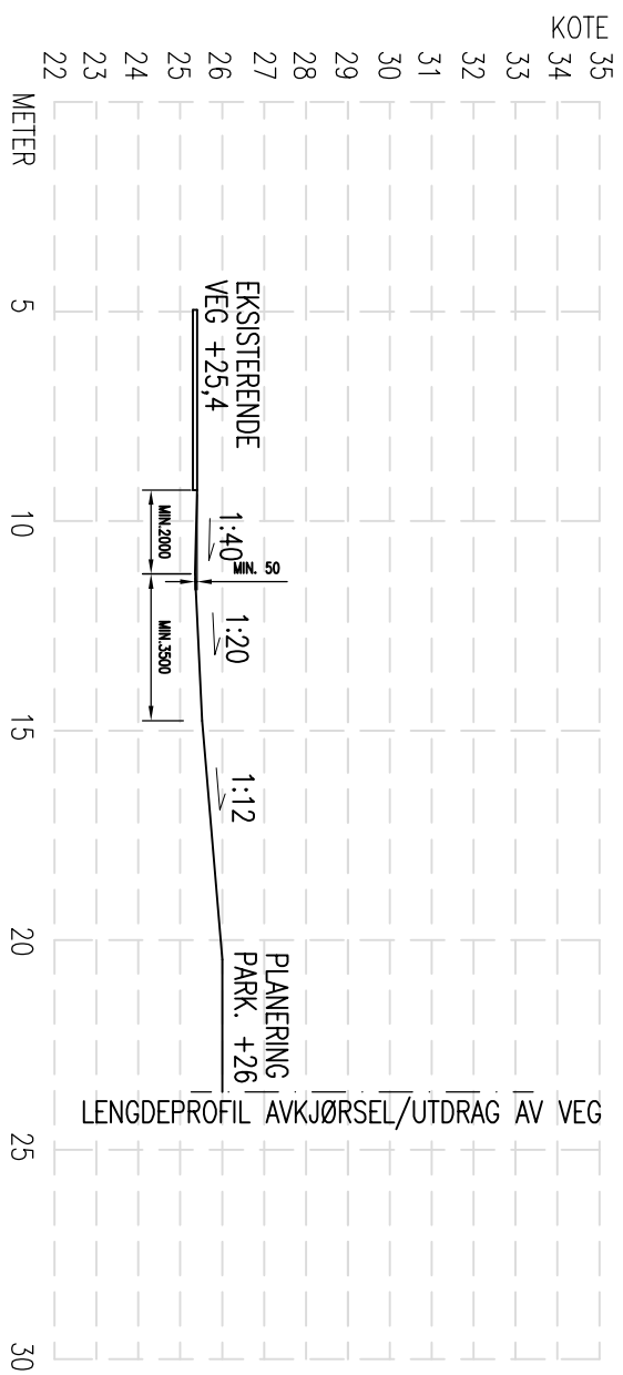
LENGDEPROFIL AVKJØRSEL/UTDRAG AV VEG