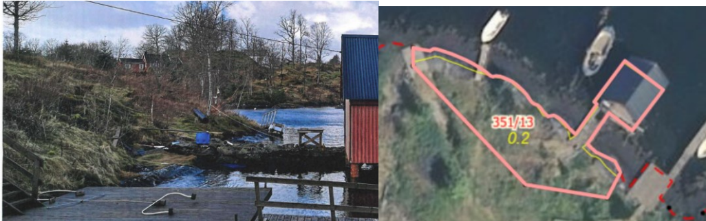
Figur 1. Arealet har ei rufsete overflate og delvis tilvaks med busker og kratt og fyller truleg ikkje krava til innmarksbeite