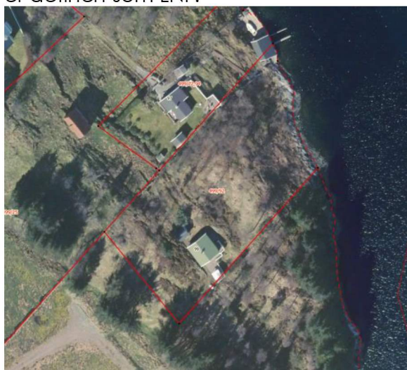
Utsnitt frå nordhordlandskart.no

Eigedomen ligg i uregulert område innanfor det som i kommuneplanen sin arealdel er definert som LNF.