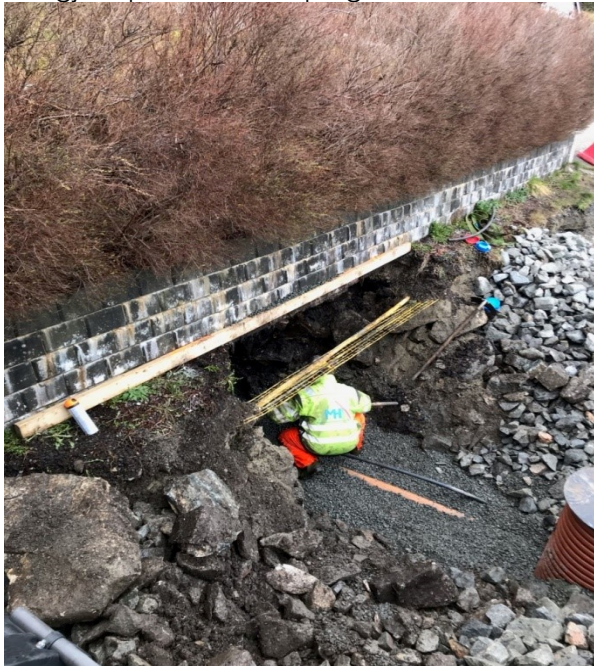
Figur 2 Arbeid med djup grøft ut frå privat eigedom

Prosjektområdet går inn på mange private eigedomar. Kommunen må gjere tilpasningar til den enkelte tomt mot kommunal veg og VA-anlegg. Det er krevande arbeid som kommunen må gjere på ein heilskapleg måte.