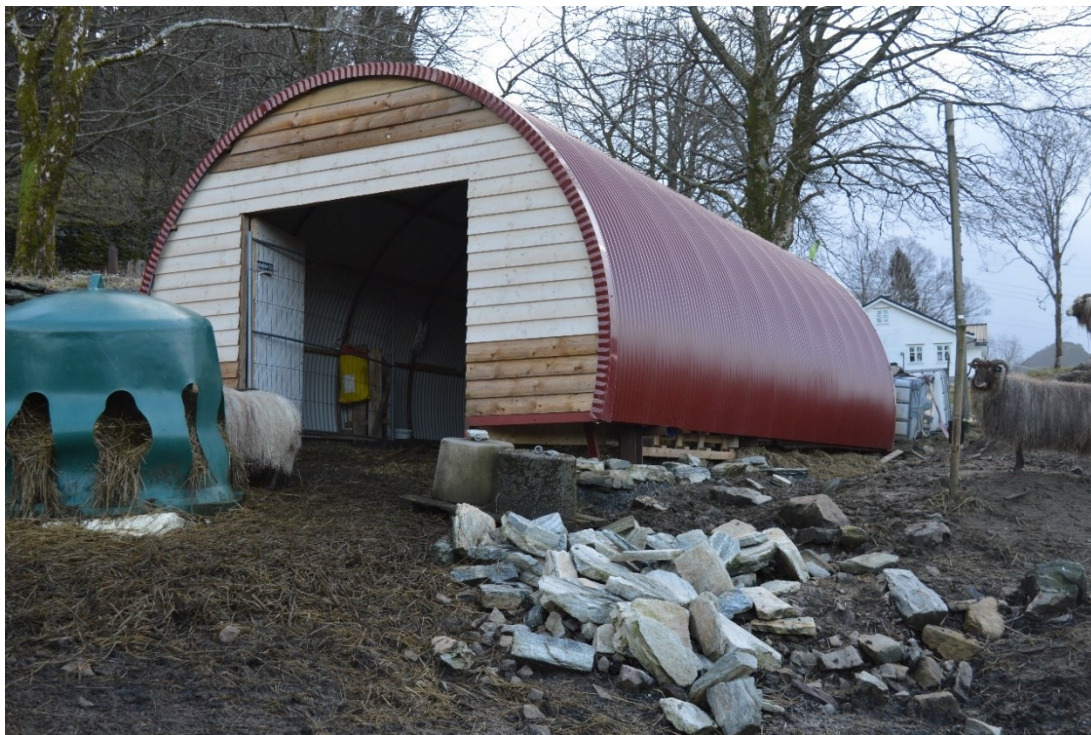
Figur 2 Massar frå postvegen.

klyngetunet, datert til 1200-talet, på den andre. Rubbhallen er plassert innfor sikringssona på det automatisk freda kulturminnet, men i hovudsak er det postvegen som er mest råka og skada av tiltaket. Vel 20 meter av veglegemet er gravd vekk, og det er i staden fylt på pukkk som grunn for rubbhallen. Massar frå postvegen ligg like ved.