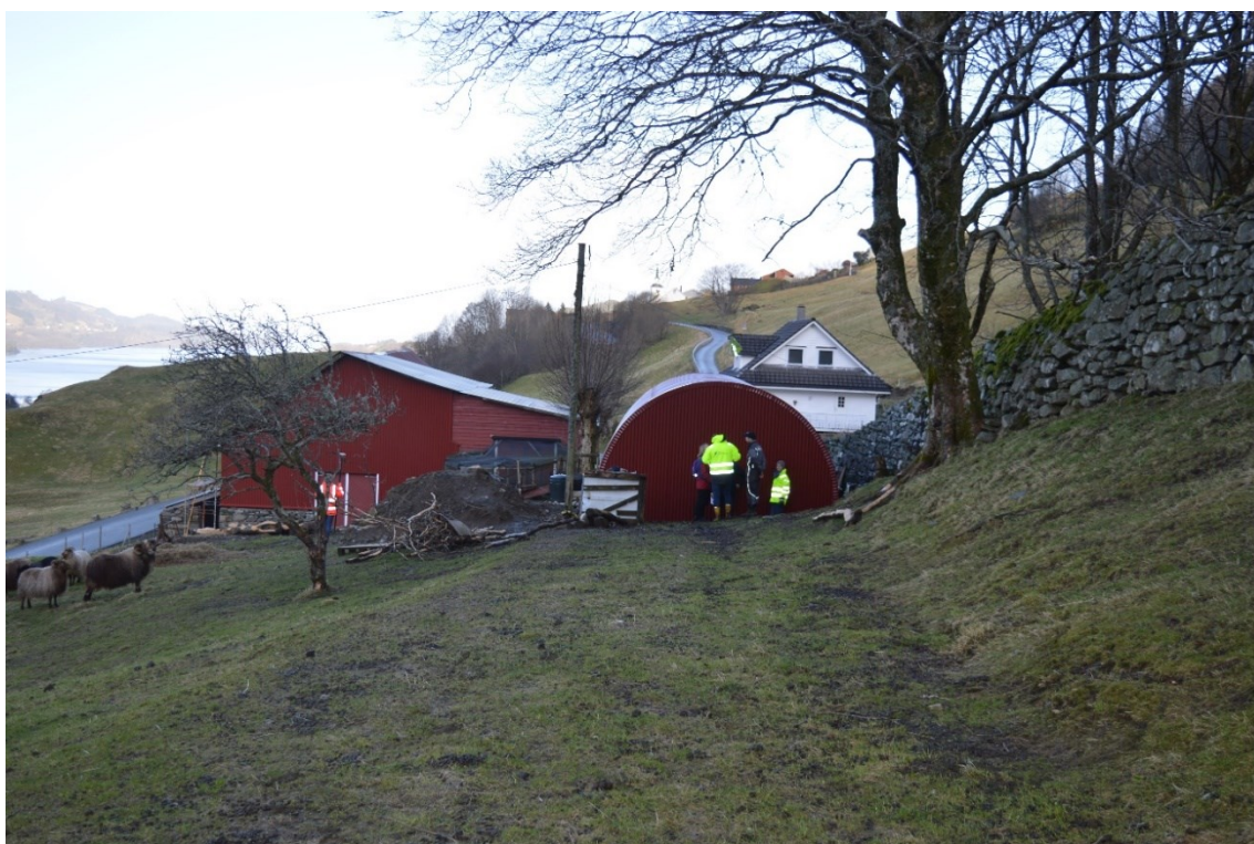
Figur 3 Bilete tatt frå postvegen og syner rubbhallen si plassering midt på vegen.