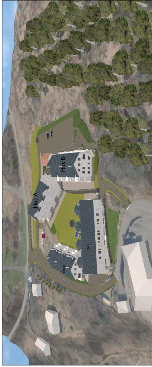
Sett frå sør