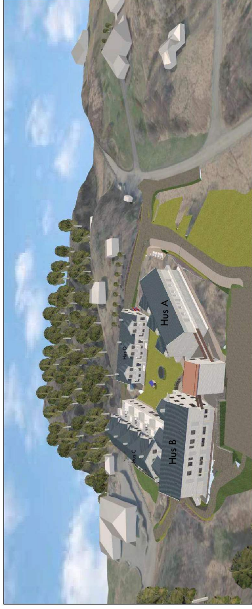
Sett frå øst