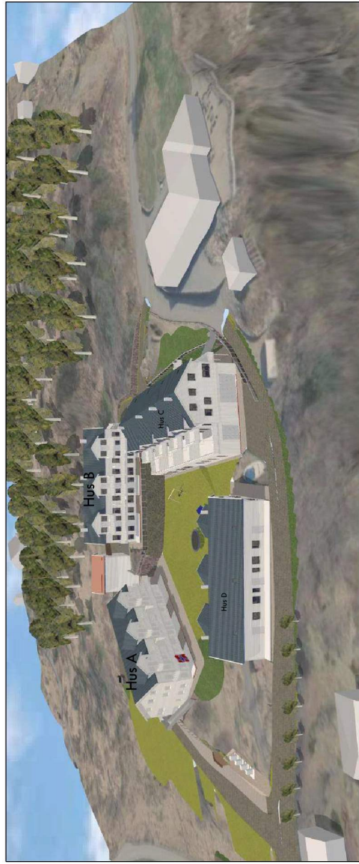
Sett frå vest