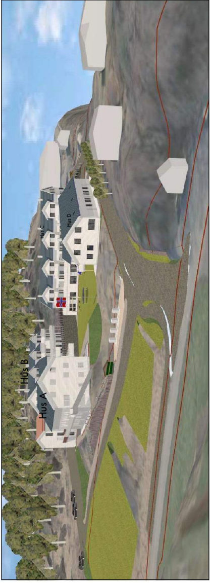
Sett frå nord-vest