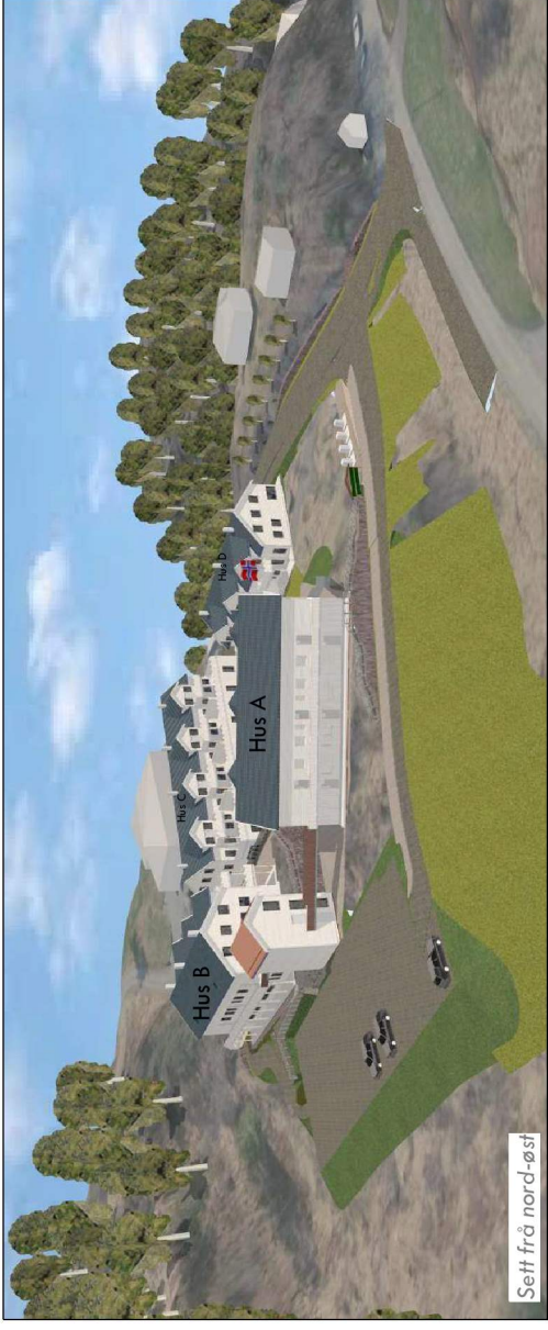
Sett frå nord-øst