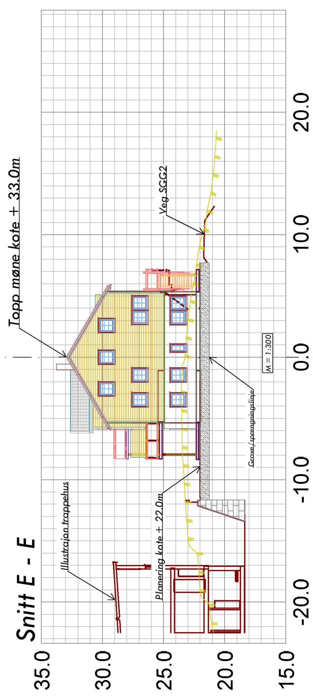
Snitt E - E