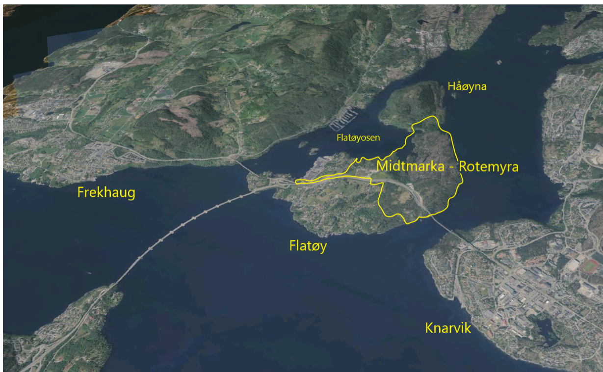
Figur 1 Planforslagets lokalisering mellom Knarvik og Frekhaug på Flatøy. Linja avgrensar planområdet. (Kartgrunnlag: Norkart).

I administrasjonen sin fråsegn av 19.02.2020 blei det fremja administrative motsegner knytt til trafikktryggleik og kulturminne (sjå vedlegg 1). Det blei og varsla at administrasjonen ville rå til motsegn på grunnlag av motstrid mot retningslinjer i Regional areal- og transportplan for Bergensområdet. Statens vegvesen og Fylkesmannen i Vestland har og fremja motsegn til planen, der motsegnstema er samordna bustad-, areal- og transportplanlegging, trafikktryggleik, landbruk, strandsone og konflikt med pågåande planarbeid for ny E39.