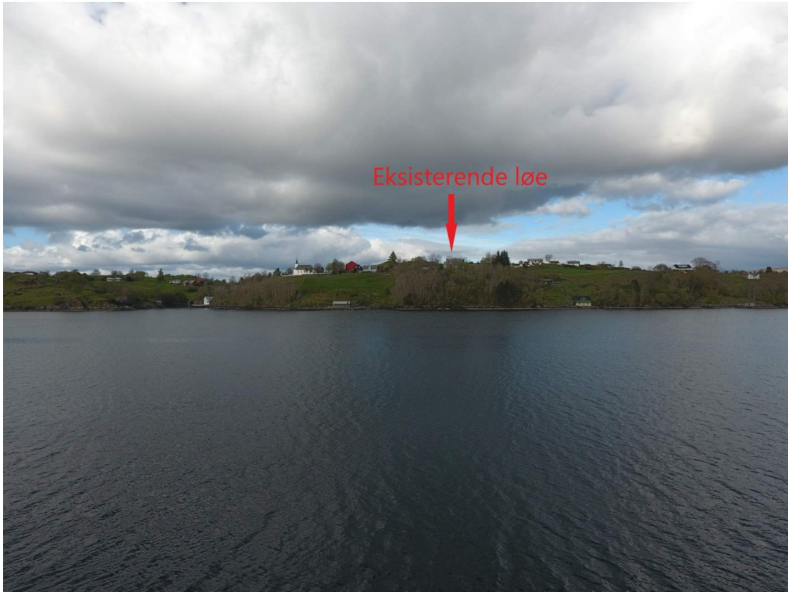
Bildet er tatt fra sjøen, omtrent i hovedleia i Lurosen.