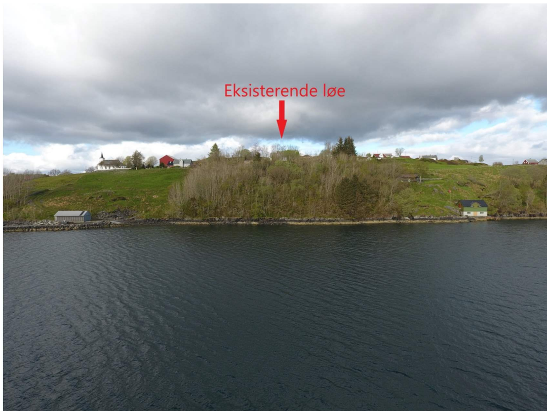
Bildet er tatt fra sjøen ca 100m fra land. Her kan man så vidt se eksisterende bolig og løe. Bildet er i tillegg tatt før det har kom løv på trærne.