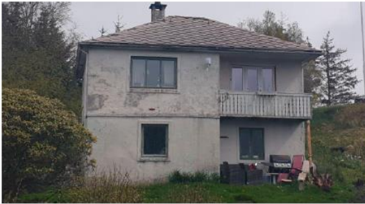
(fasade sør vest)

Eksisterende byggverk på aktuelle eiendom er et gammelt mur bygg med valmet tak.