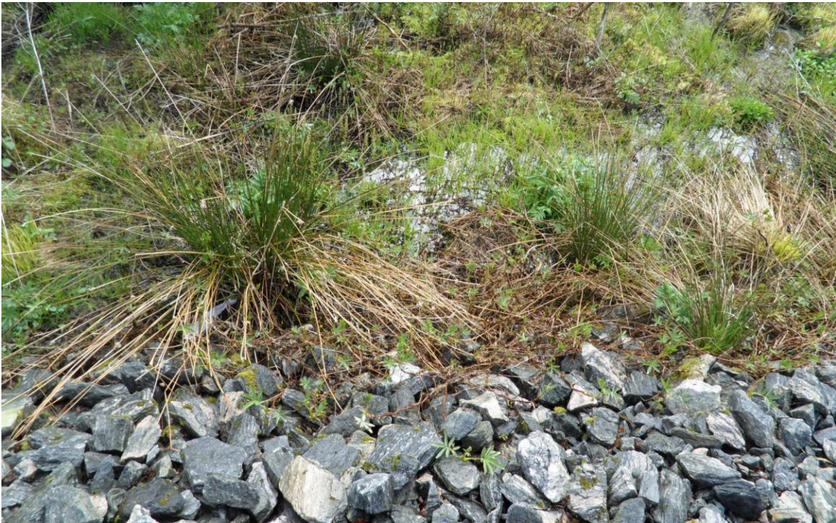
Midtre dam har ikkje overløp, men vatnet rett ut igjennom fyllinga.