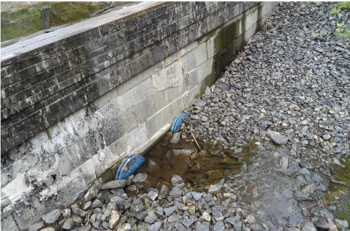
Nedre dam har ikkje overløp, men vatned ren ut nede.