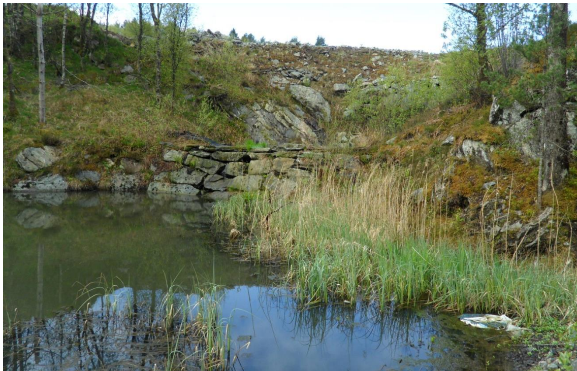
Den øvre dammen har overløp i toppen av dammen.

har ikkje direkte tilknytning til knusverket som har kommet på plassen dei siste ukene. Men det fremstår som dammane inngår i tiltaka som skal hindra avrenning til elva i frå arbeidet med å planera ut heile planområdet.