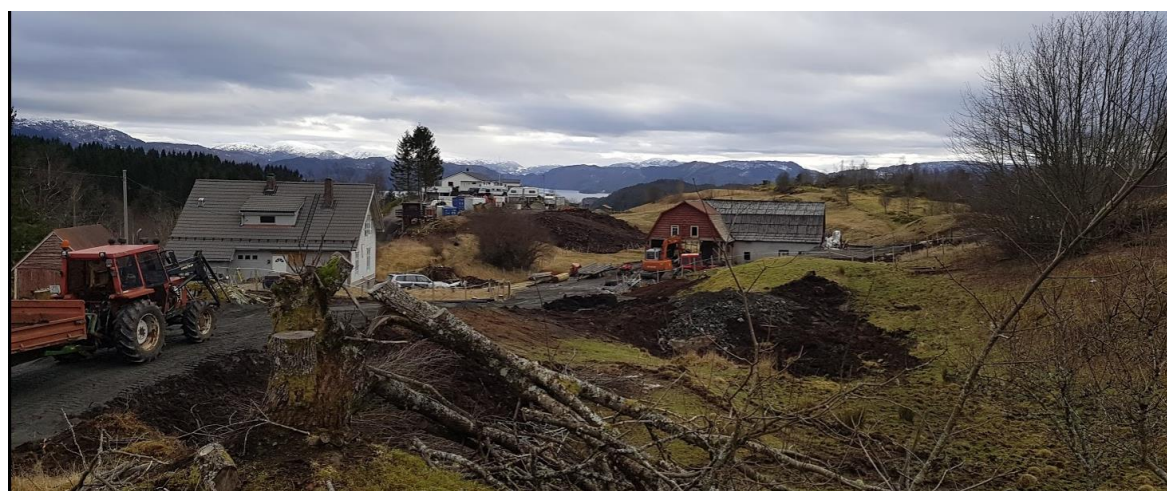
Figur 2 Foto frå tunet. Området for jordpåfylling mellom driftsbygning, gammalt våningshus og nyare hus lengst vekk i bilde