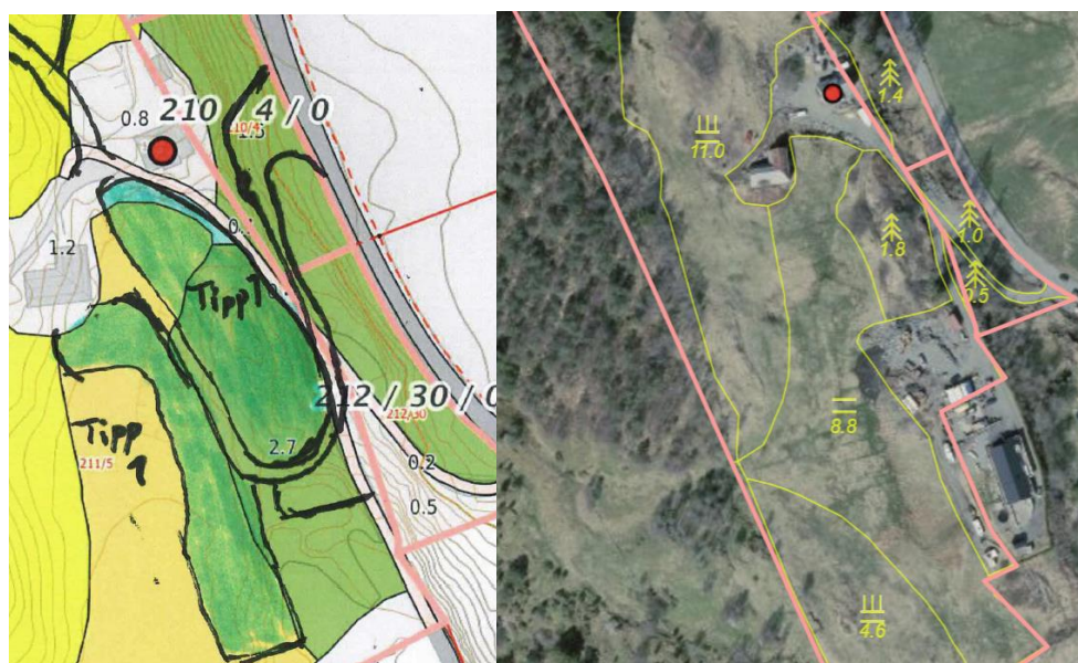
Figur 1 kart frå søknad som viser tipp 1 og ortofo som viser same området

Landbruksavdelinga var på synfaring saman med søkjar 6.mars 2020.