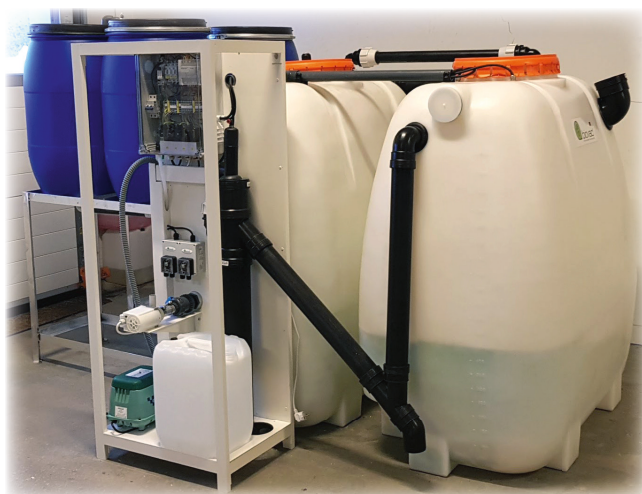
BIOVAC® FD5 MG