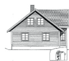
FD 5 MG, Mottakstank på gulv i kjeller