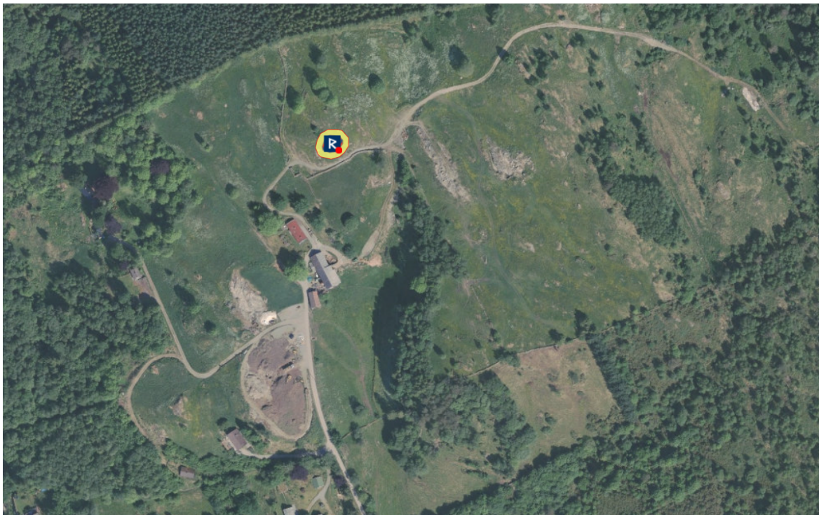
Figur 1. Rune R visar automatisk freda gravhaug med tilhøyrande sikringszone.

Det er potensiale for funn av automatisk freda kulturminne i området, spesielt gjeld dette for Terrengendring/fyllingsfeltet i nord (felt 2). Dyrka mark har potensiale for funn av flatmarksgraver, åkrar og gardstun frå bronse-, jarn- og mellomalder. Vi finn det dermed naudsynt med ei arkeologisk registrering i dette feltet for å avgjere om tiltaket kjem i konflikt med hittil ikkje registrerte kulturminne, jf. § 9 i kulturminnelova. Jf. § 10, må kostnadene ved registreringa dekkast av tiltakshavar. Eige brev med nærare opplysningar om den arkeologiske registreringa vert ettersend når etterspurde tilleggsinformasjon er motteke.